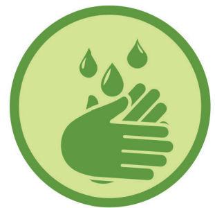
Hände waschen, Hygieneregeln einhalten!