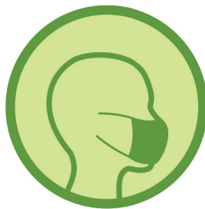
Medizinische Mund- Nase-Bedeckung