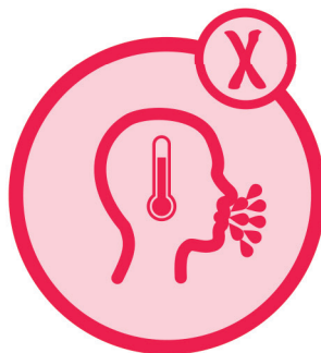
Bei Symptomen: Zuhause bleiben!